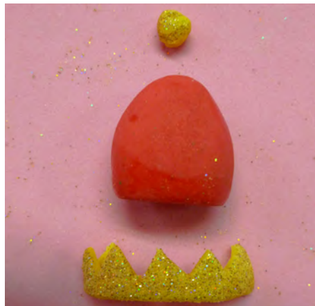
Pegar alrededor de una cono rojo y pegar una bolita en el extremo • Attach the crown around a red cone and attach a little ball on top