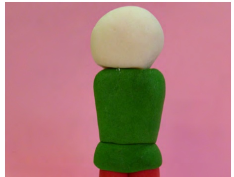
Realizar una bolita de 2 cm en pasta de goma color piel y pegarla con agua sobre el cuerpo • Make a ball of 2 cm skin colour and attach with water on the body