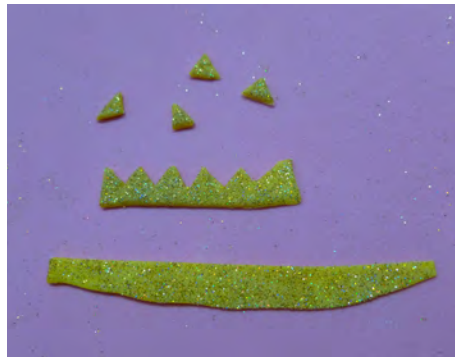
Realizar el mismo procedimiento de las tiras y cortar una coronita • Make crowns using the same technique in photo 16