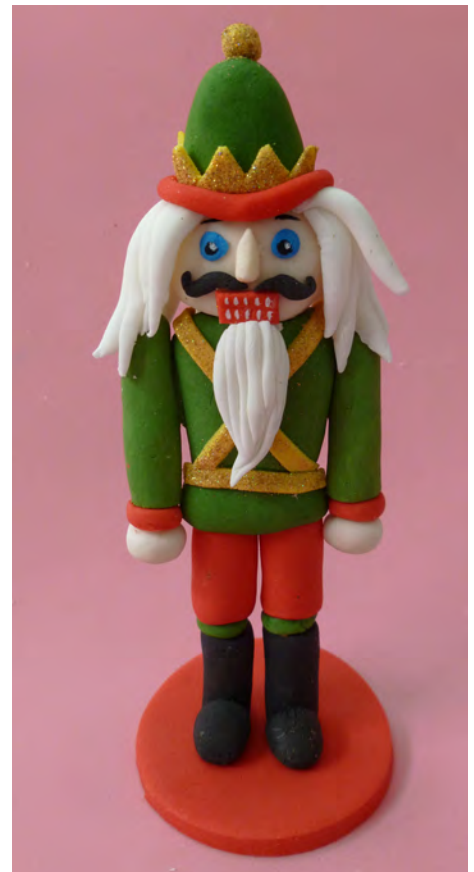
Pegar el muñequito en un círculo de pastillaje rojo • Attach the doll on a red circle of pastillage (base)