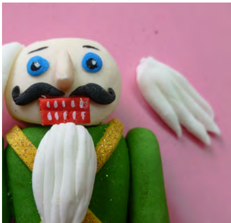
Del mismo modo realizar mechones para el cabello y pegarlos alrededor de la cabeza • Make the hair strands and attach them around the head