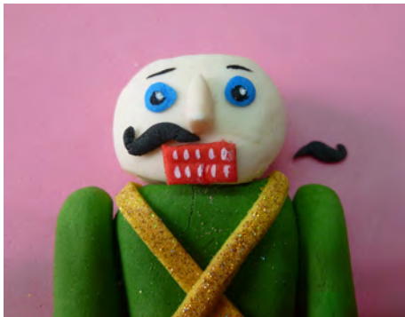
Pintar las cejas, el brillo en la mirada y pegar con agua los bigotes en pasta de goma negra • Paint the eyebrows, the light of the eyes and attach with water the moustache made with gum paste