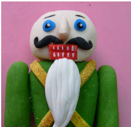
Para la barba modelar un cono, texturar con una esteca y pegar con glase al tono • Make a cone, texture the surface imitating the beard and attach with royal icing of same color