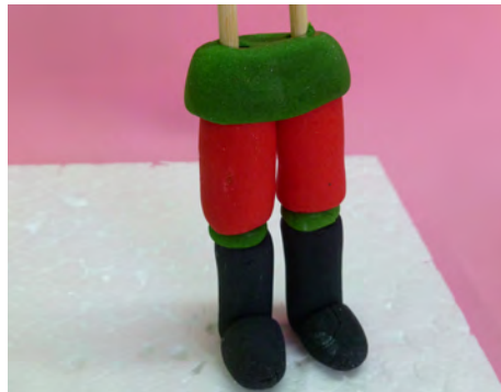
Insertarla en los palitos de brochete y pegarla con agua • Insert the skewers in the green ball and attach with water