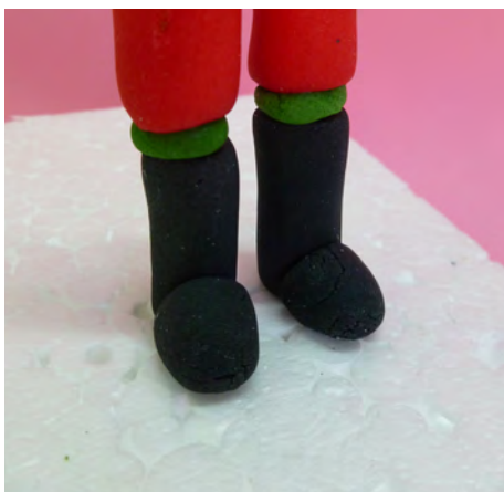
Modelar dos rollitos de 2 en pasta de goma roja, insertarlos en los palitos y pegarlos con agua • Make 2 rolls in red gum paste, insert the skewers and attach with water