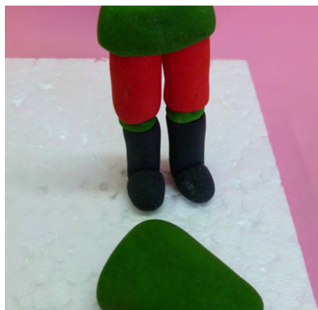
Modelar un cono de 4 cm de largo y aplanar el extremo • Make a cone of 4 cm and flatten one end