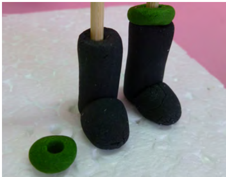
Realizar dos bolitas verdes, aplanarlas, insertarlas en los palitos y pegarlas con agua sobre la bota • Make 2 green ball, flatten them, insert the skewers and attach with water