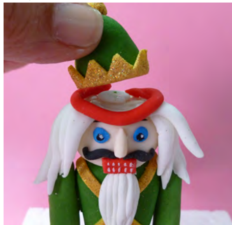
Pegar un rollito de pasta roja sobre la cabeza y colocar el sombrero • Attach a little red cone on the head and place the hat