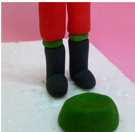
Realizar una bolita de 3 cm en pasta de modelar verde, aplanarla • Make a ball of 3 cm in green color and flatten it