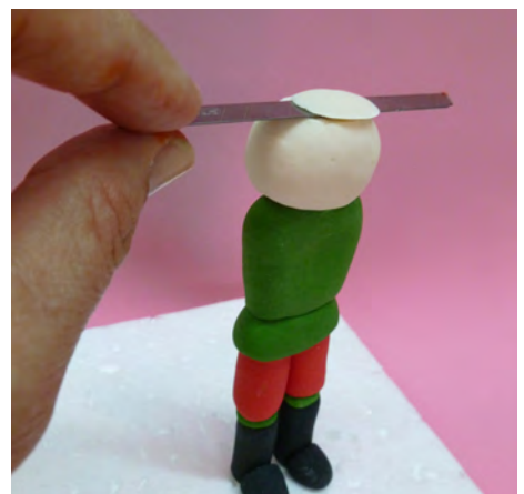
Cortar la parte superior de la cabeza con un cutter. • Cut the upper part of the head