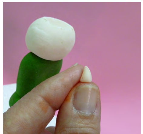
Modelar un pequeño conito para la nariz y pegarlo con agua • Make a little cone for the nose