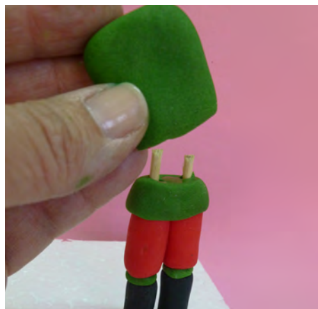
Cortar los palitos e insertar el cono. Pegarlo con agua • Cut the skewers and insert in the cone. Attach with water