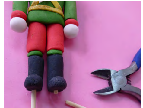
Cortar los palitos de brochete con una pinza • Cut the skewers with a pair of pliers